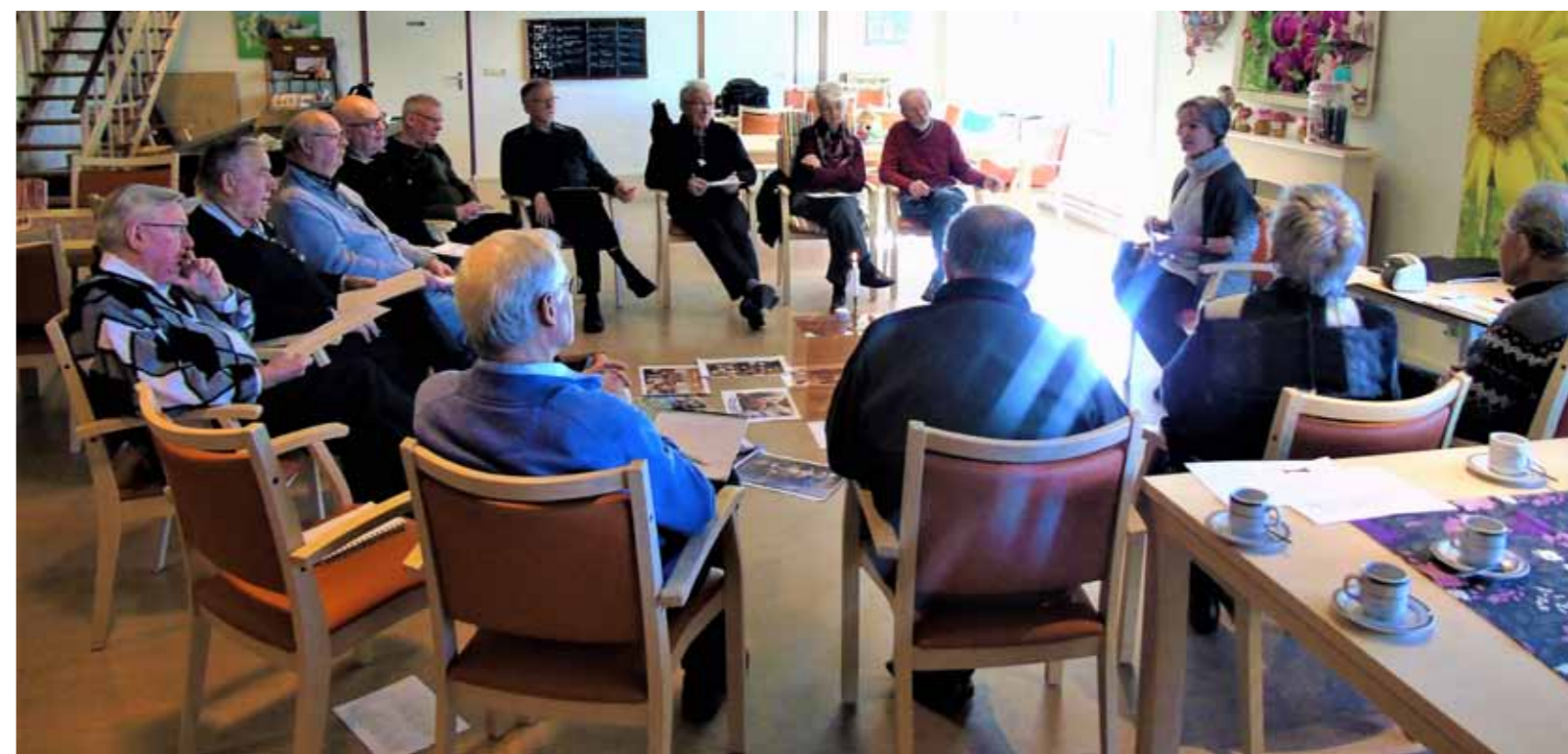
Bezinning op de Scharck