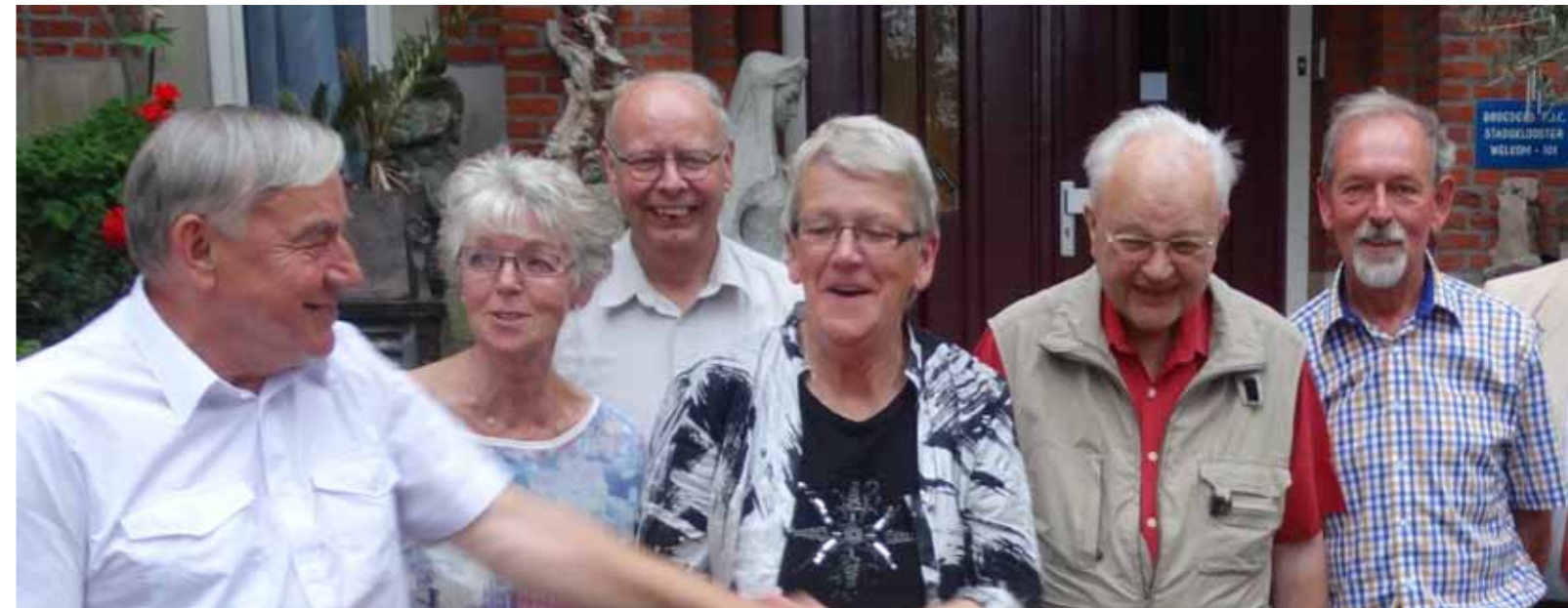
Ontmoeting in het Stadsklooster