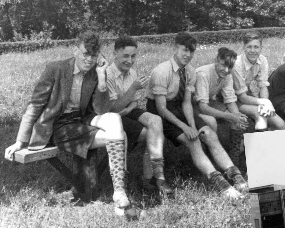
1951, Maastricht. Kwekelingen / Teacher training college